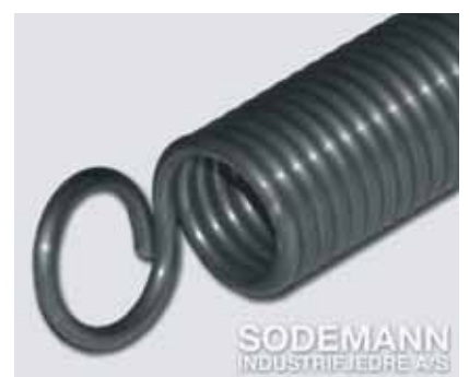
9. Sidehengte øyne