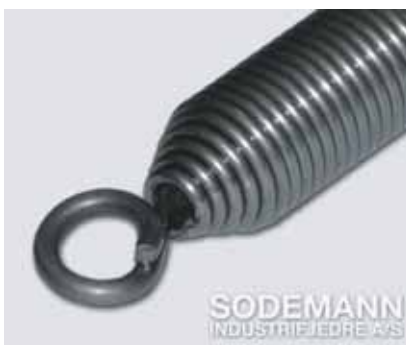
7. Løse innkonede øyne