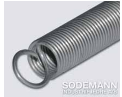
3. Engelske øyne