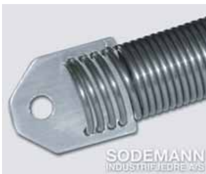
10. Plate Øyne