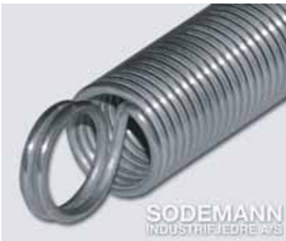
4. Dobbelt Engelske øyne