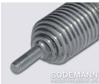
8. Løse innkonede Bolte