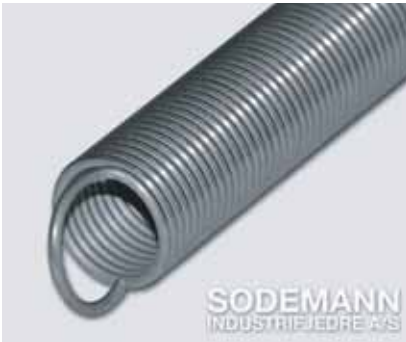
1. Hele tyske øyne