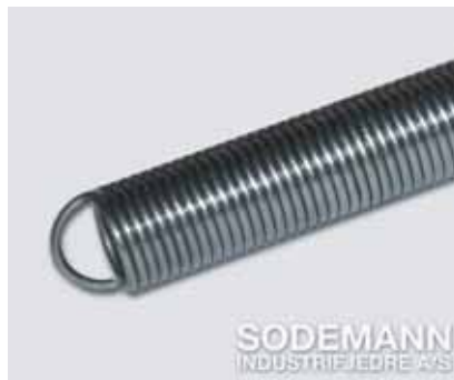
2. Halvt tyske øyne